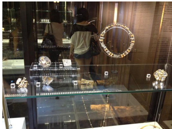
(觀看新北市立黃金博物館的德國當代金工大展)

我覺得暑假實習是很好的學習，暨在學校學習後，透過實習能了解到未來就業或是社會現實中能往什麼方向、能做些什麼事，有更清楚的模樣，可以讓我對畢業後的夢想能有更明確的規劃去實踐，因此我覺得實習除了實務上外，也對我生涯規畫有重要的影響力，能更了解以後可做些什麼？如何做也可更上層樓？如何更能快樂地做一份工作，而非為了薪水而保有一份工作，而是可以將自己喜愛的與共同結合在一起。